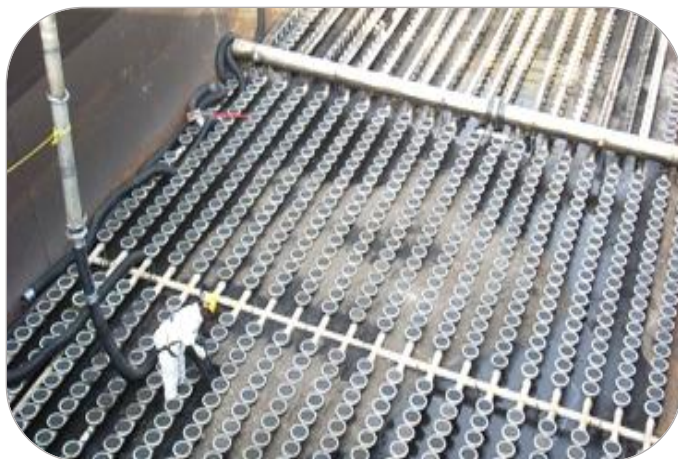
BOLHA FINA: DIFUSOR POR DISCO ( FIXO OU REMOVÍVEL )