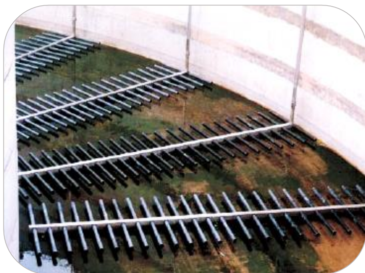
BOLHA FINA: DIFUSOR TUBULAR ( FIXO OU REMOVÍVEL )