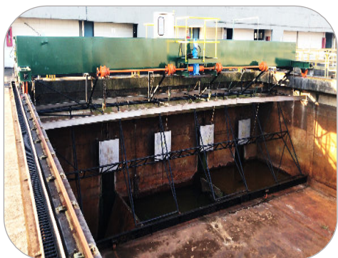
RASPADOR DE FUNDO