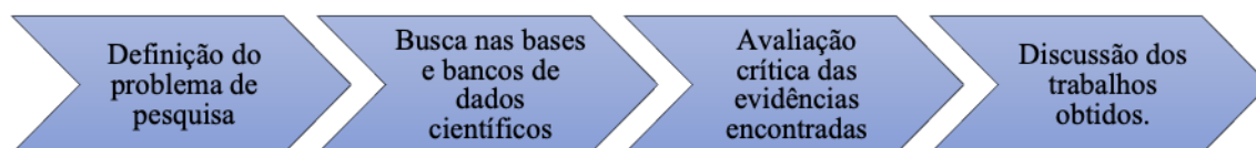
Figura 1. As etapas para elaboração da pesquisa científica.

Este trabalho consiste em uma revisão integrativa de artigos científicos referentes aos parâmetros de potabilidade da água para consumo humano. Para o desenvolvimento da pesquisa, seguiram-se as seguintes etapas: definição do problema de pesquisa, busca nas bases e bancos de dados científicos, avaliação crítica das evidências encontradas e discussão dos trabalhos obtidos (Figura 1).