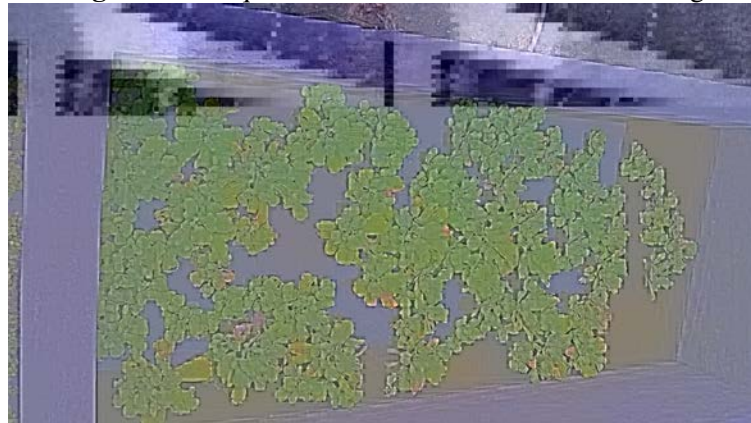
Figura 2: Tanque 02 - Pistia stratiotes , ou alface d'água