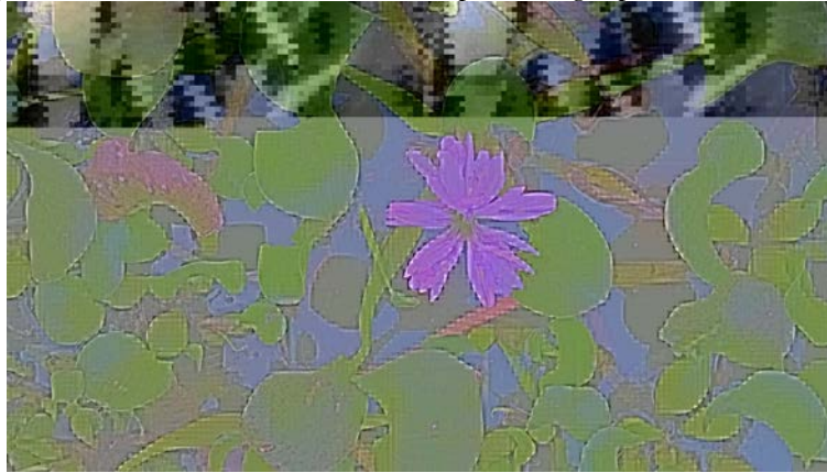
Figura 1: Tanque 01 - macrofita Eichhornia crassipes ou Aguapé