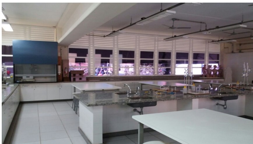
Figura 1: Laboratório químico da PUC-Minas Barreiro.

biológicas da PUC- Minas unidade Barreiro, onde durante o ano letivo, a cada semestre, é realizada a produção de água destilada para a execução de práticas químicas, complementando cada prática proposta pelos professores e favorecendo aos alunos um melhor aprendizado.