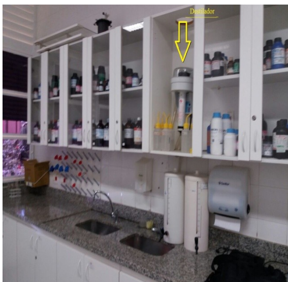
Figura 2: Destilador do laboratório.