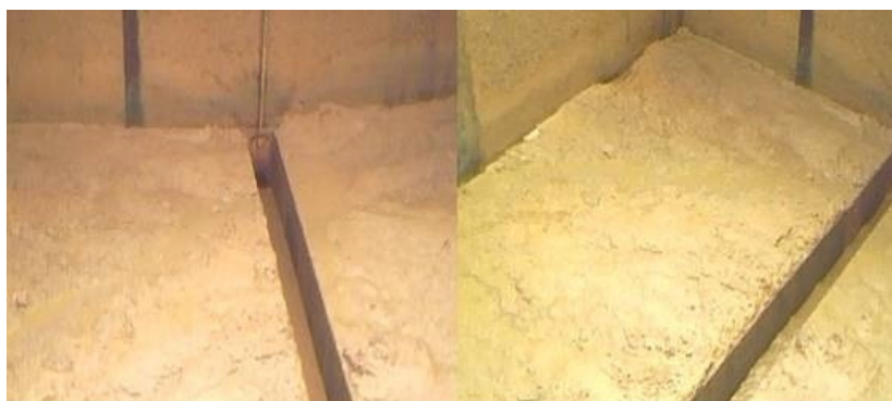
Figura 1. Desidratação do lodo gerado nos decantadores da ETA do SAAE de Formiga – MG.

O lodo gerado nos decantadores apresenta elevada umidade (cerca de 90%), então, para sua caracterização, foi realizada a desidratação do mesmo, como mostra a Figura 1.