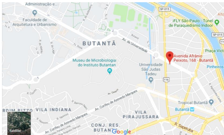
Figura 2: Localidade da amostra de água pluvial (AP).