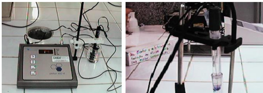
Figura 5 – ANALYSER PH/ION 450M de leitura (em mV) nitrato.

A figura 5 apresenta uma foto do equipamento.