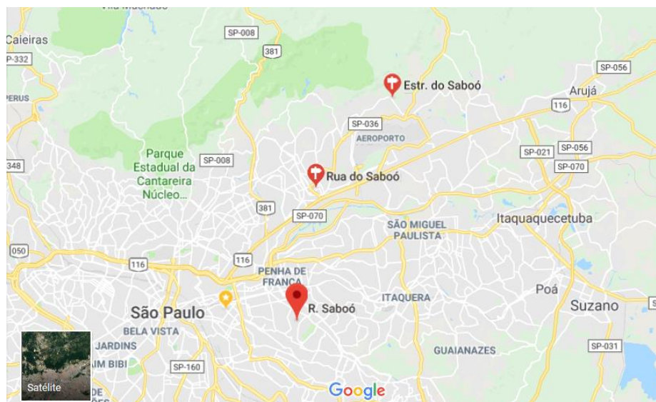
Figura 3: Localidade da amostra de água subterrânea (AS).