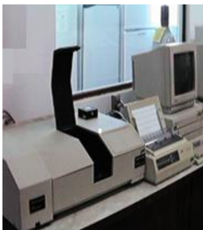
Figura 4: Equipamento de espectrofotometria.

A figura 4 apresenta uma foto do equipamento de leitura.