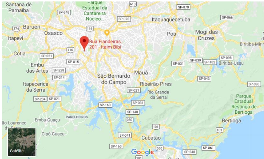
Figura 1: Localidade da amostra de água cinza (AC).