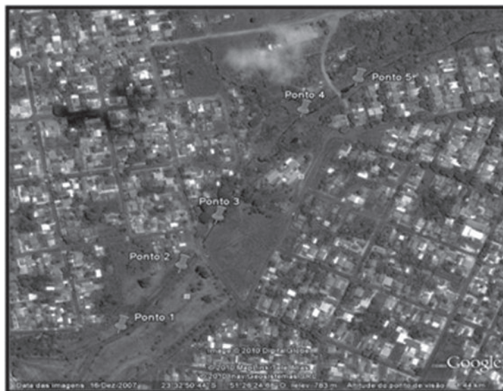
FIGURA 2: Localização do córrego Japira na cidade de Apucarana – PR e os pontos analisados destacados.

O presente trabalho foi realizado no Córrego Japira, pertencente à Bacia do Rio Tibagi no perímetro urbano da cidade de Apucarana, nas coordenadas 23°32'.87''S e 51°26'18''O, o qual atravessa o Núcleo Habitacional João Goulart e deságua na Represa do Schmidt, nas coordenadas 23°32'11.79''S e 51°25'45.54''O. A área analisada possui 780 metros de extensão. Em alguns trechos o córrego apresenta-se degradado, desprovido de mata ciliar adequada e vestígios de contaminação por descargas de esgoto doméstico e lixo.