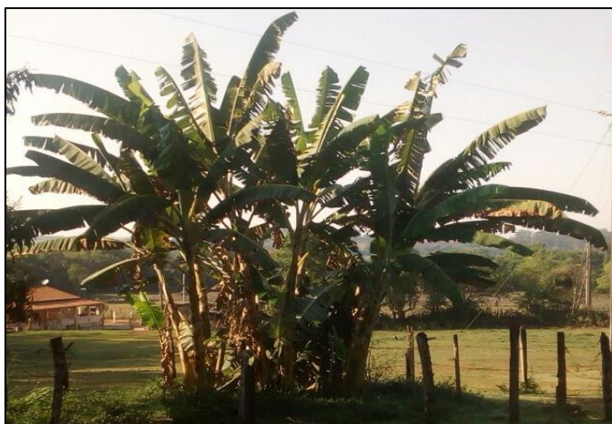
Imagem 6 – Imagem atual da bananeira.