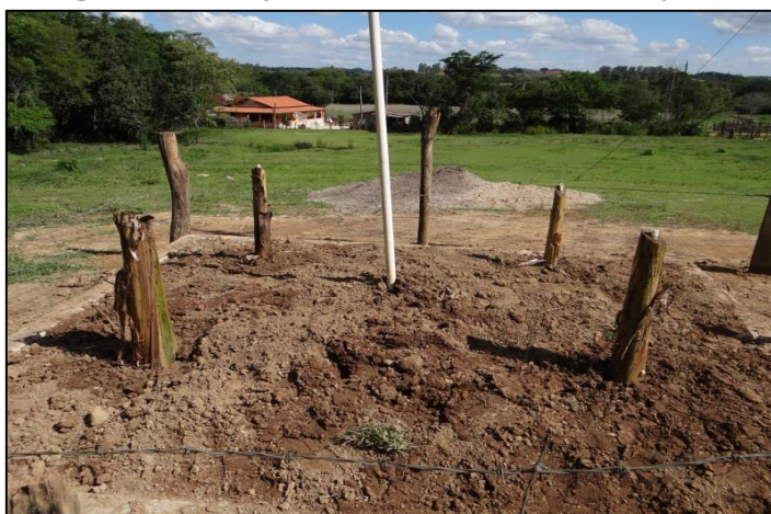
Imagem 4 – Superfície com areia e cano para coleta do efluente.

Após a passagem central receptora dos desejos, inicia-se o processo das camadas filtrantes que promoverá o tratamento para absorção das plantas na parte superior do sistema. Para formação desta camada foi adicionada uma camada de 20 cm (vinte centímetros) de areia de rio, contendo pedregulho e 40 cm (quarenta centímetros) de solo. Em seguida, um tubo de inspeção de 50 mm (cinquenta milímetro) de diâmetro foi adicionado para manutenção e coleta de amostras do efluente.