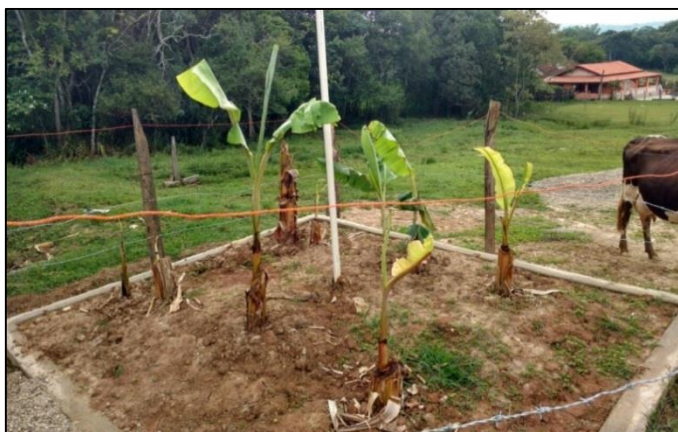
Imagem 5 – Fase inicial da bananeira na superfície do sistema.

Acima do tanque onde foram plantadas 5 (cinco) mudas de bananeiras do tipo Prata ( Musa paradisiaca ), que por processo de evapotranspiração, a água é eliminada do sistema, enquanto os nutrientes presentes são removidos por meio da sua incorporação à biomassa das plantas. Este processo busca suprimir a necessidade de pós-tratamento, pois, esperasse que o efluente seja completamente absorvido e evapotranspirado pelo plantio.