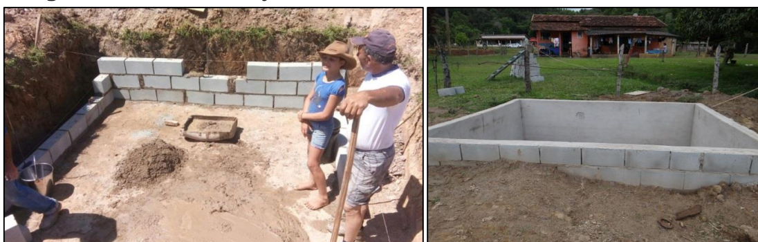
Imagens 1 e 2 – Construção da alvenaria cimentada.

O tanque tem como estrutura o mesmo sistema realizado pela Galbiati (2009), modificando-se algumas medições para atender os seis residentes da propriedade. Similarmente foi montada uma alvenaria cimentada, sobre uma trincheira feita no solo, com fundo nivelado nas dimensões de 1,30 (um vírgula e trinta) de profundidade por 3 metros (três metros) de largura e 3 metros (três metros) de comprimento.