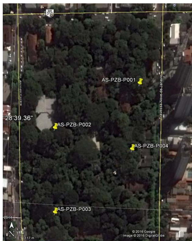
Figura 1: Localização georreferenciada dos poços instalados no Parque Zoobotânico de Belém (PZB) do MPEG para captação de água subterrânea.