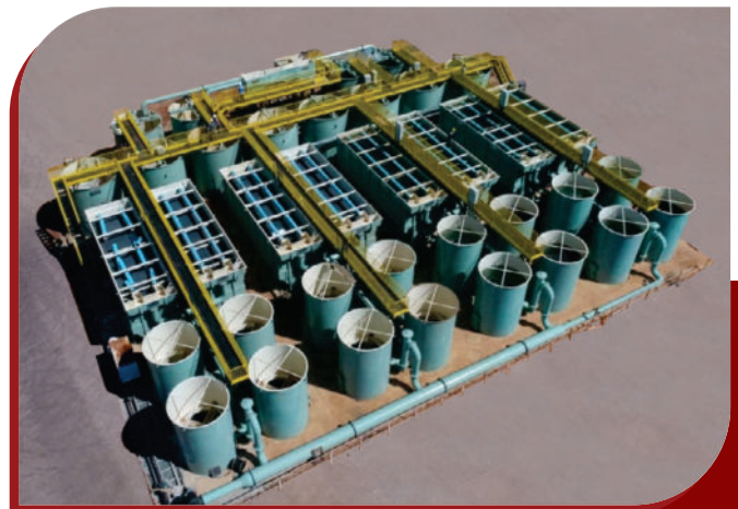
•ETA em PRFV 50 l/s