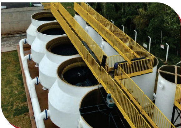
•ETA em Aço Carbono 350 l/s