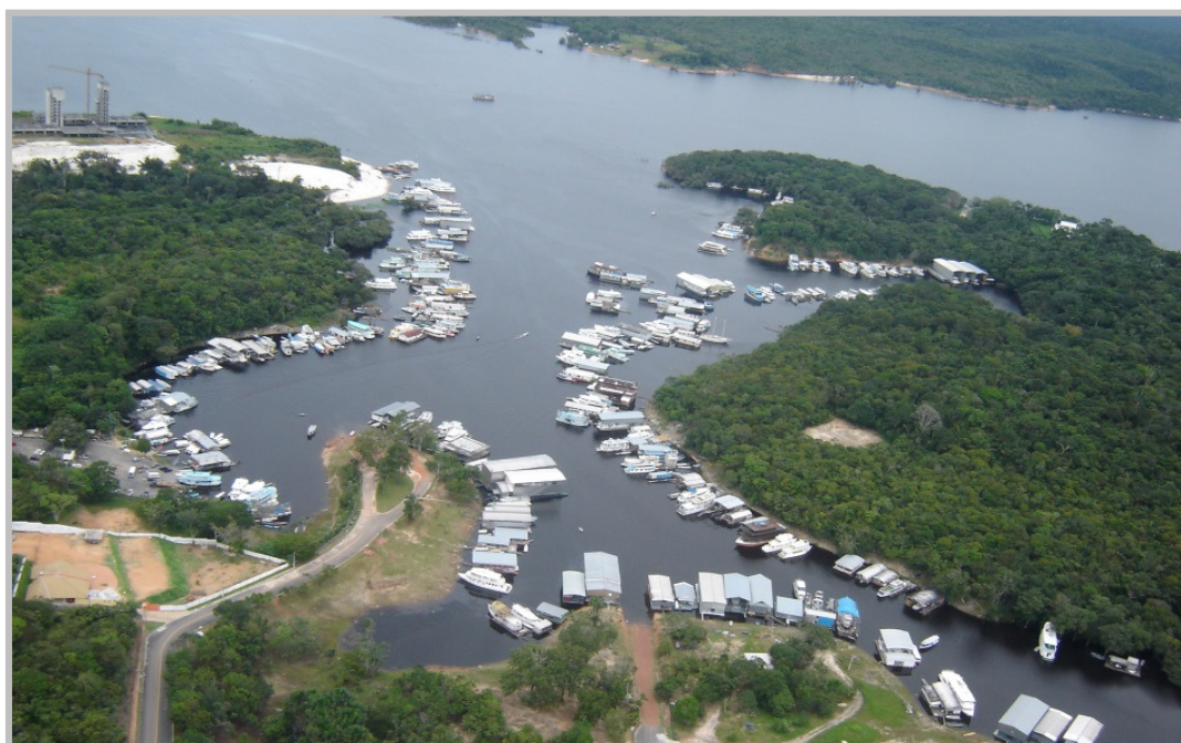
Figura 3 – Marinas na Bacia do Tarumã-Açu.

Atualmente, a área é ocupada por condomínios residenciais de alto padrão, marinas (Figura 3), clubes de lazer, restaurantes flutuantes, cemitérios (Tarumã e Parque Tarumã), indústrias, hotéis de selva, ocupações desordenadas (São Pedro, São Sebastião, Auxiliadora, São José, São Jorge, Santa Rosa, Santa Maria, São Tomé e Marquinhos), Aterro Sanitário (antigo Aterro Controlado implantado na área ocupada por um vazadouro à céu aberto), por comunidades indígenas (Saterê-Mawé Inhambé e Caniço-Rouxinol) e Áreas de Proteção Ambiental (APA Margem Esquerda do Rio Negro e APA Tarumã-Mirim). Além dos referidos tipos de ocupação, no leito do Rio Tarumã e de seus afluentes são realizadas atividades de extração mineral, com dragagem de areia e seixo sem os licenciamentos ambiental e mineral pertinentes.