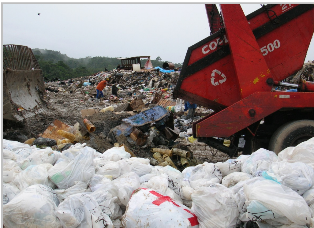
Figura 4 – Vazadouro de resíduos domiciliares, industriais e hospitalares.

Os estudos realizados por Santana e Barroncas (2007), complementados por Buhring (2010) e Santos et al. (2006), afirmam que parte dos afluentes do Rio Tarumã-Açu está com algum tipo de contaminação em decorrência da percolação do chorume produzido no aterro sanitário, localizado no Km 19 da Rodovia AM-010, instalado na área de um antigo vazadouro de resíduos domiciliares, industriais e hospitalares (Figura 4) que esteve em atividade por mais de vinte anos, ou proveniente dos postos de gasolina que lançam seus efluentes diretamente no rio, ou em virtude dos resíduos e efluentes domésticos gerados nos bairros do entorno e despejados no Igarapé do Matrinchã que junto com o Igarapé do Acará e demais tributários formam o Igarapé do Mariano que deságua na margem esquerda do Rio Tarumã-Açu.