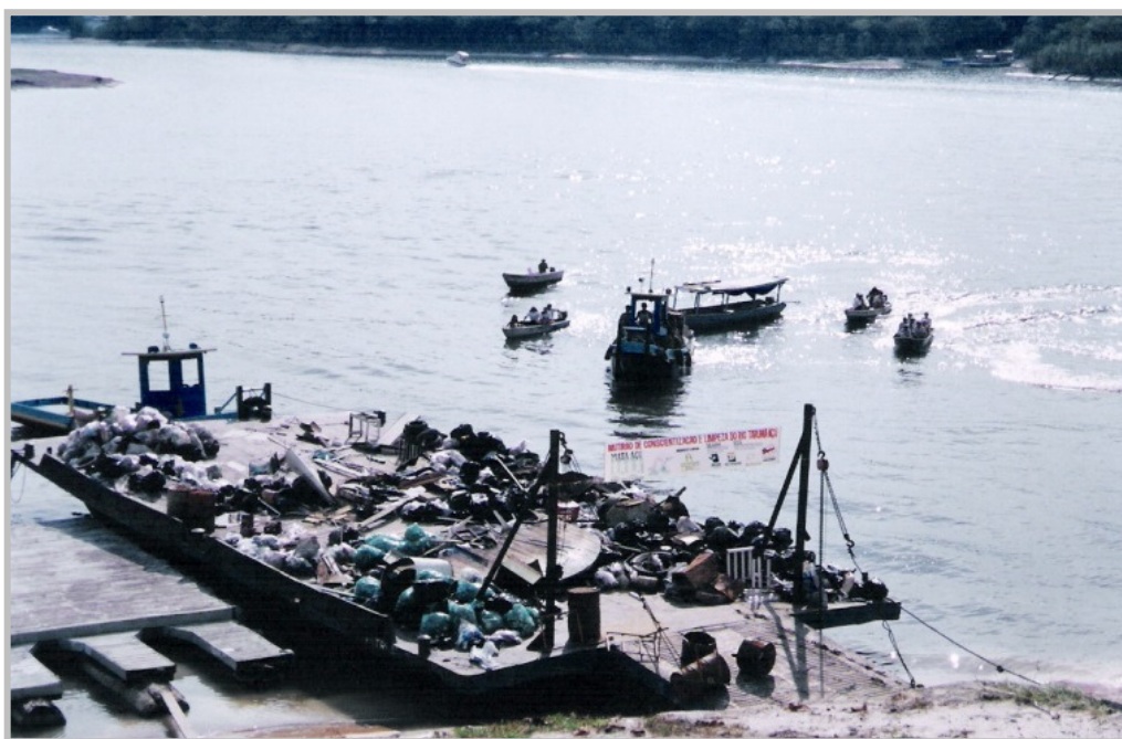
Figura 6 – Balsa com 55 toneladas de resíduos retirados da Bacia do Tarumã-Açu.

A Prefeitura Municipal de Manaus, por meio da SEMULSP, com o serviço de 35 agentes de limpeza (garis) durante cinco dias, realizou a retirada de 500 toneladas de resíduos gerados em seis comunidades ribeirinhas do Rio Tarumã. Nesta ação foi utilizada uma balsa que transportou os resíduos para o Porto do São Raimundo, onde foram transferidos para os caminhões basculantes e encaminhados para a destinação final no Aterro Sanitário de Manaus (SEMULSP, 2011).