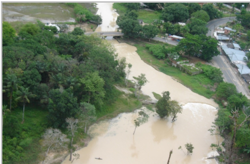
Figura 5 – Assoreamento da Cachoeira Baixa do Tarumã-Mirim.

Outro impacto ambiental significativo é o assoreamento que em 15 anos levou a extinção da Cachoeira Baixa do Tarumã-Mirim (Figura 5).