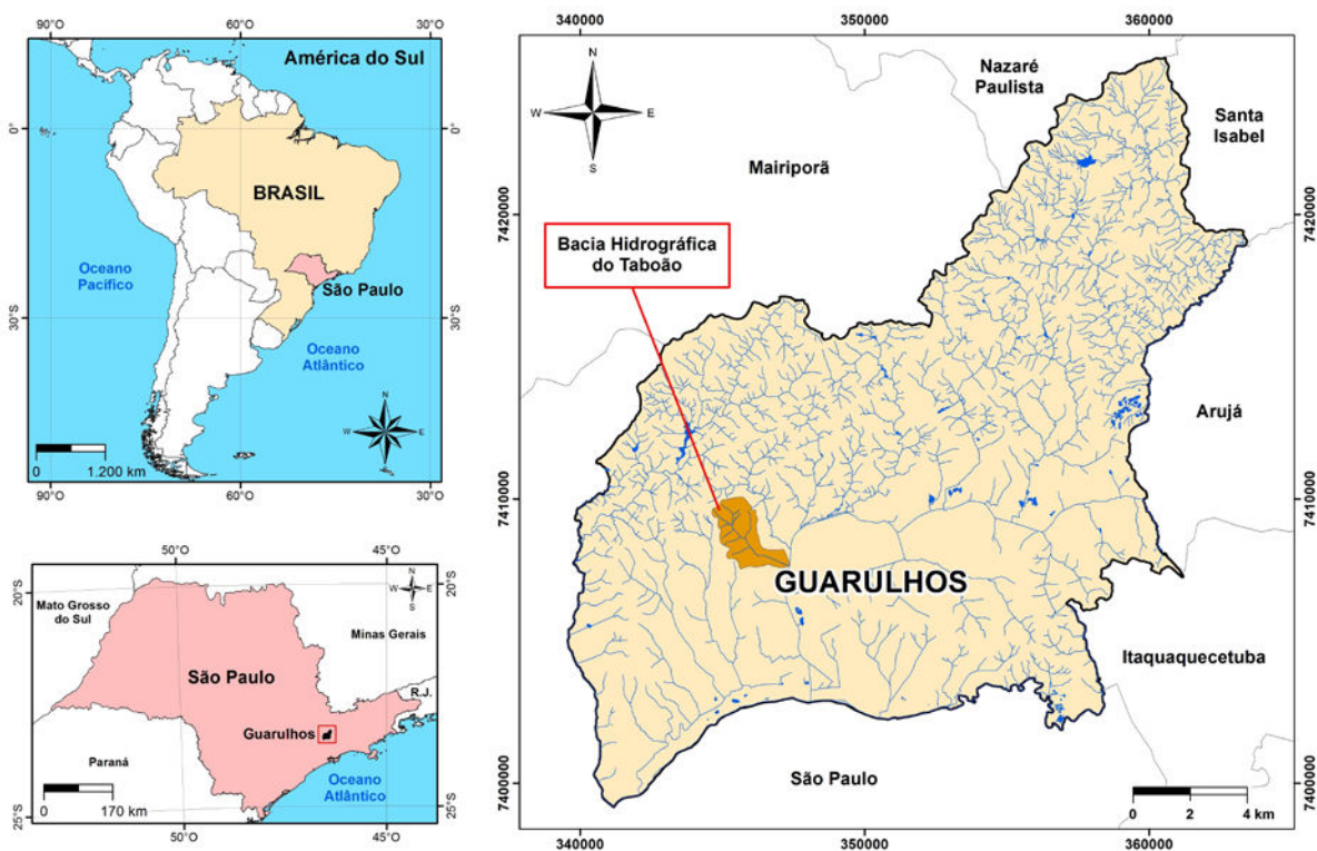
Figura 1. Localização geográfica da Bacia Hidrográfica do Córrego Taboão no município de Guarulhos (SP)

A área de estudo, a Bacia Hidrográfica do Córrego do Taboão (BHCT) apresentada na Figura 1, é um dos contribuintes da Bacia Hidrográfica do Rio Baquirivu-Guaçu, principal bacia do Município de Guarulhos. Com uma área de 3,5 km 2 está localizada a centro-oeste do município, limitando-se ao norte com os bairros da Invernada Cachoeirinha e Cabuçu de Cima; a oeste com os bairros Morros e Bela Vista; a sul com Vila Barros; e a leste com a área do Aeroporto Governador Franco Montoro (Aeroporto Internacional de Guarulhos).