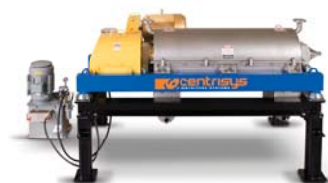
Centrífugas de Espessamento série THK