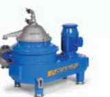
CENTRÍFUGAS DE DISCO