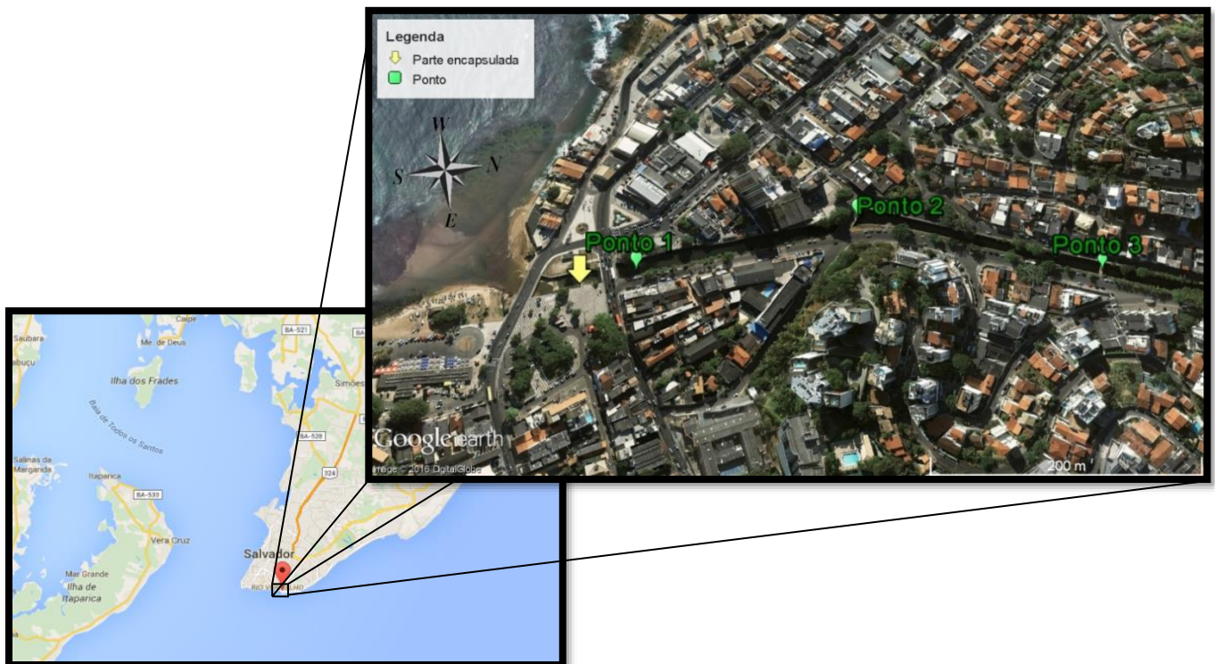
Figura 1: Imagem da localização da área de estudo e a distribuição dos pontos de coleta